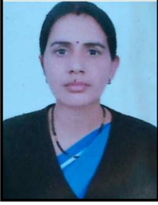
आचार्य निलम (अ.) रा.उ.प्रा.वि. कच्छावतान तारानगर